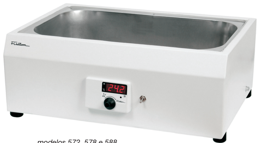
modelos 572, 578 e 588