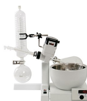
Evaporador rotativo Mod. 804 – cód. 008041 – 115V – cód. 008042 – 230V