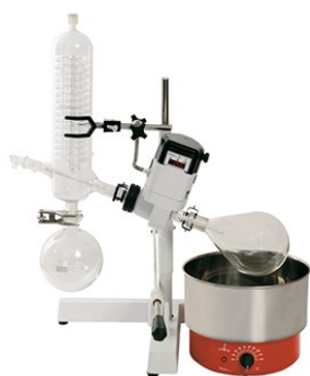
Evaporador rotativo Mod. 802 – cód. 008021 – 115V – cód. 008022 – 230V