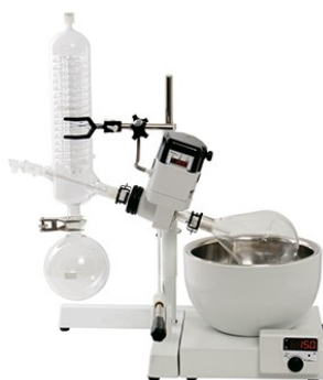
Evaporador rotativo Mod. 803 – cód. 008031 – 115V – cód. 008032 – 230V