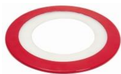
Splash Guard Protetor contra respingos – cód. 100.540 – 27