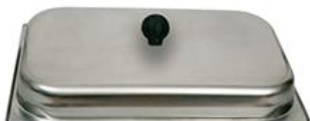
Tampa de cobertura com altura de 6 cm – cód. 260.450