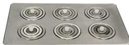
Tampa de 6 bocas Com redução de diâmetro 10,5; 8,6; 6,4 e 3,6 cm, em todas as bocas – cód. 260.440