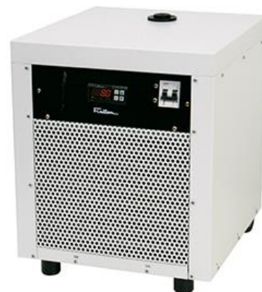
Resfriador de líquidos mod. 850 – cód. 008502

Características técnicas podem mudar sem prévio aviso