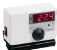
Regulador de temperatura Mod. 411 – cód. 411S31 – 115V – cód. 411S32 – 230V