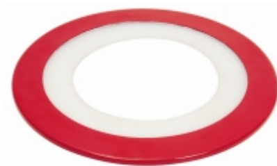
Splash Guard Protetor contra respingos – cód. 100.510 – 302