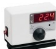
Regulador de temperatura mod. 411 – cód. 411S31 – 115V – cód. 411S32 – 230V