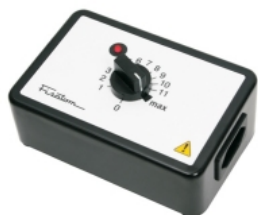
Regulador de potência mod. 407 – cód. 000407 – 115V~230V