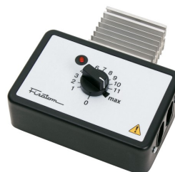
Regulador de potência mod. 408 – cód. 000408 – 115V~230V