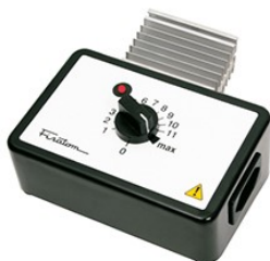
Regulador de potência mod. 409 – cód. 000409 – 115V~230V