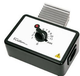
Regulador de potência Mod. 409 – cód. 000409 – 115V~230V