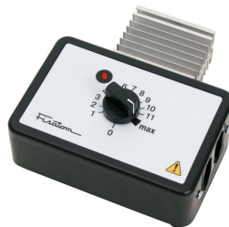
Regulador de potência Mod. 408 – cód. 000408 – 115V~230V