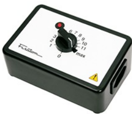
Regulador de potência Mod. 407 – cód. 000407 – 115V~230V