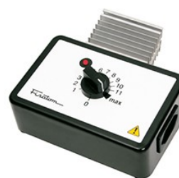
Regulador de potência Mod. 409 – cód. 000409 – 115V~230V