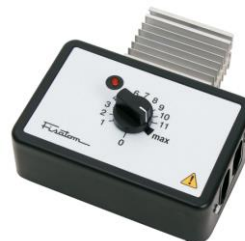
Regulador de potência mod. 408 – cód. 000408 – 115V~230V