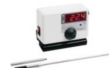
Regulador de temperatura mod. 411 – cód. 411S31 – 115V – cód. 411S32 – 230V