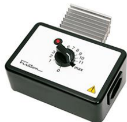
Regulador de potência mod. 409 – cód. 000409 – 115V~230V