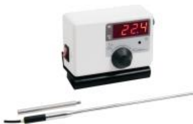
Regulador de temperatura Mod. 411 – cód. 411S31 – 115V – cód. 411S32 – 230V