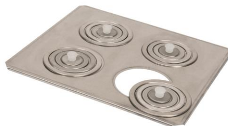
Tampa de 4 bocas Com redução de diâmetro 10,5; 8,6; 6,4 e 3,6 cm, em todas as bocas. – cód. 260.430