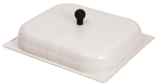
Tampa de cobertura com altura de 6 cm – cód. 260.630