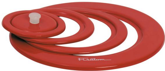
Tampa de 5 anéis Para reduções de Ø 17; 13; 9,5 e 6,5 cm – cód. 280.860