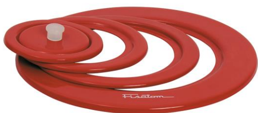
Tampa de 5 anéis Para reduções de Ø 17; 13; 9,5 e 6,5 cm – cód. 280.860