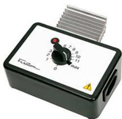
Regulador de potência mod. 409 – cód. 000409 – 115V~230V