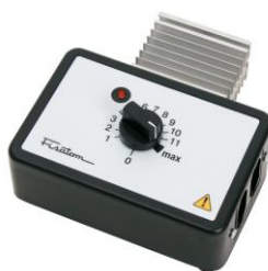
Regulador de potência mod. 408 – cód. 000408 – 115V~230V