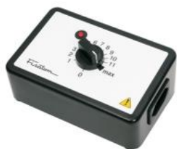
Regulador de potência mod. 407 – cód. 000407 – 115V~230V