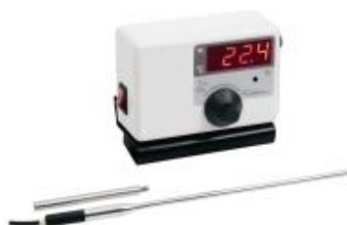
Regulador de temperatura mod. 411 – cód. 411S31 – 115V – cód. 411S32 – 230V

Características técnicas podem mudar sem prévio aviso