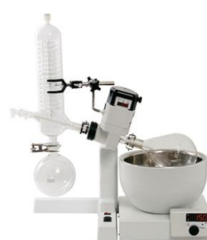
Evaporador rotativo Mod. 804