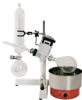
Evaporador rotativo Mod. 802