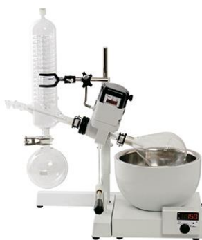
Evaporador rotativo Mod. 803